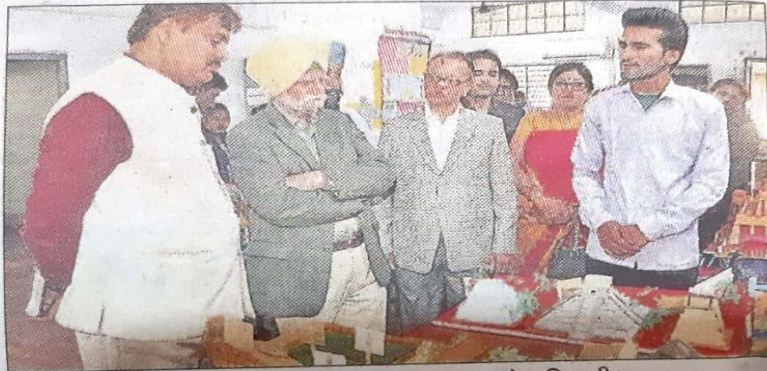
जीएन कॉलेज भूदा में विज्ञान प्रदर्शनी का उद्घाटन करते अधिकारी।