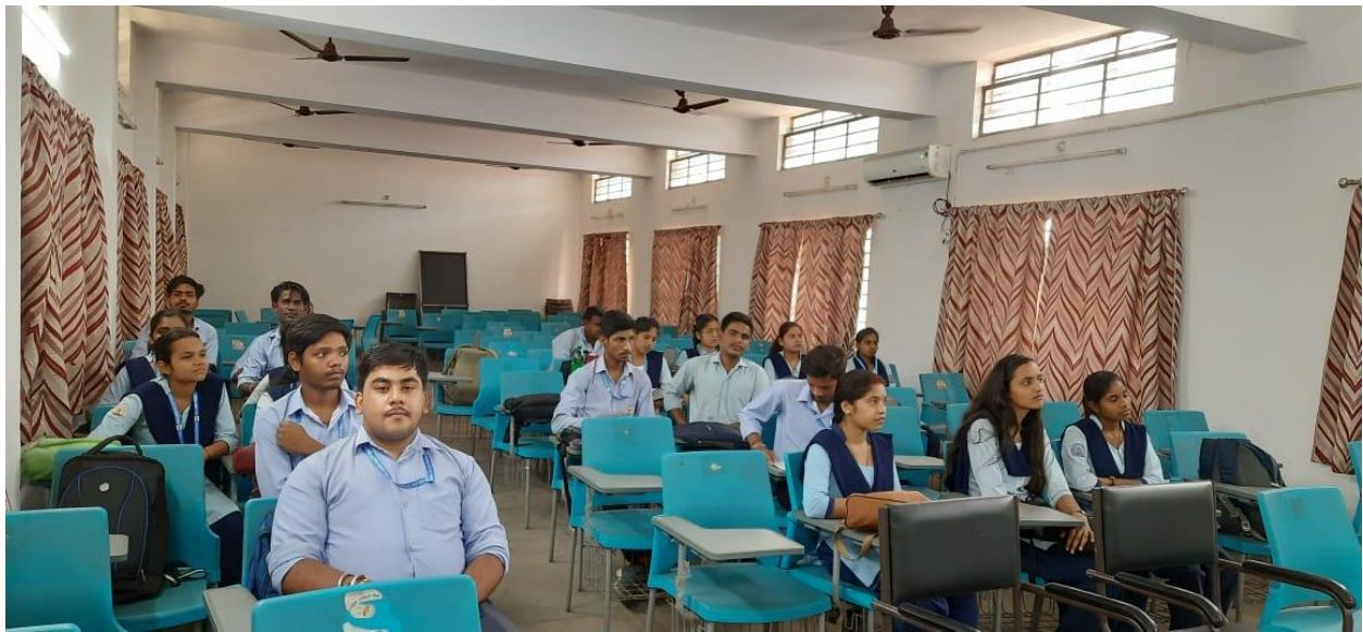
Class Seminar on " Abraham Lincon"